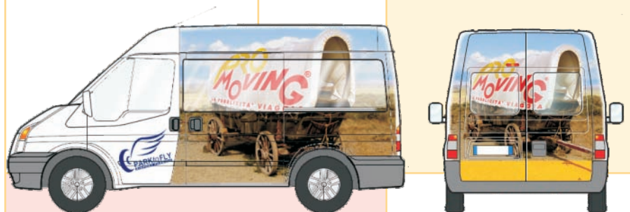
Superfici decorabili della navetta